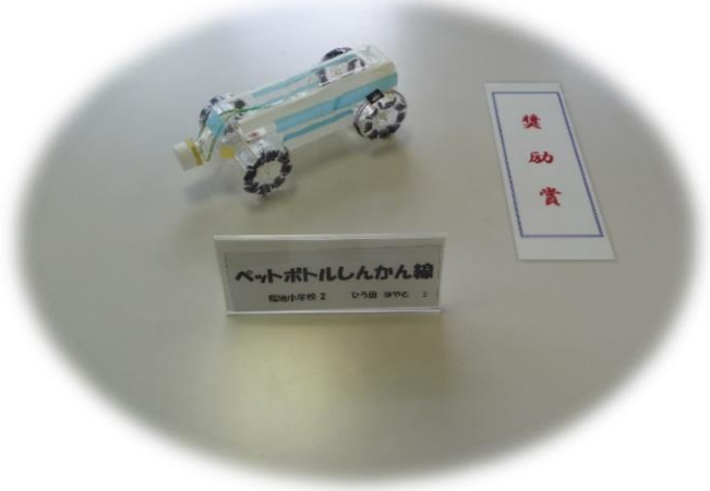
ペットボトルしんかん線 徳島小学校 2 ひろ田 夢やん 2