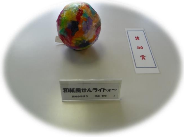
和紙風せんライト〜 徳島小学校 5 神山 悠輝 5