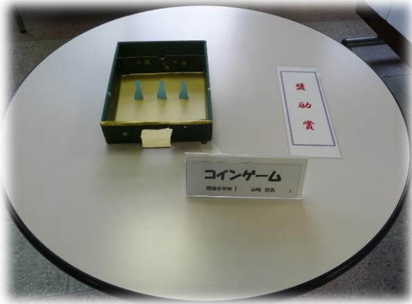
コインゲーム 徳島小学校 1 山崎 悠真 1